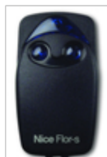
NICE FLO2R-S 2 kanałowy