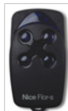
NICE FLO4R-S 4 kanałowy