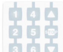
NICE WM006G 6 kanałowy