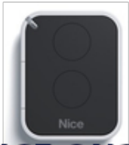
NICE ON2E 2 kanałowy