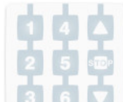
NICE WM006G 6 kanałowy