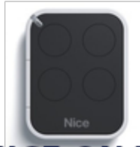
NICE ON4E 4 kanałowy