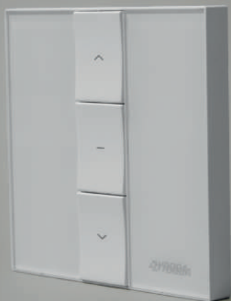
Pilot NUXO 1-kanalowy, biały (NUXO_1Rw)